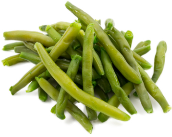
Haricots verts surgelés 2/3 tasse (81g)

1. Préparez selon les instructions du paquet.